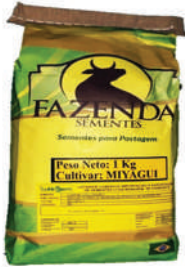
MIYAGUI (Panicum máximum cv)

Para alimentación de equinos y bovinos, mayor tenor de Proteínas que Mombaca 15%, hojas más largas y anchas, más tonelaje de materia seca por hectárea, rebrote más vigoroso.